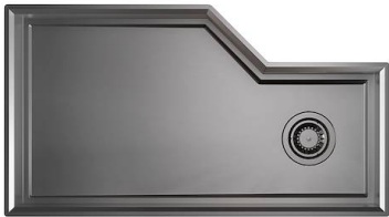
Spülbecken Diade Gun Metal Fumè 3028 816